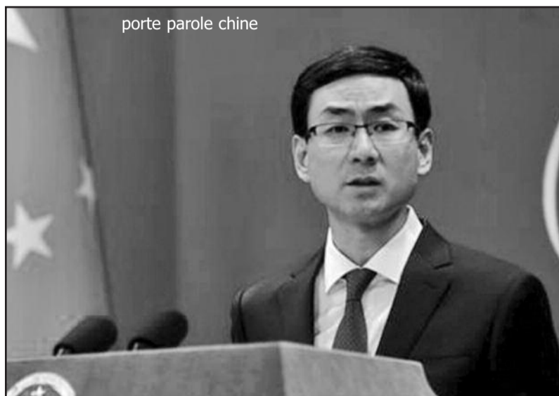
porte parole chine

Geng Shuang montre que la Chine et les Comores jouissent d'une amitié traditionnelle et que la partie chinoise attache une grande importance au développement des relations bilatérales et qu'elles entretiennent des relations amicales et traditionnelles. « Nous sommes prêts à travailler avec le nouveau gouvernement comorien pour le renforcement de la coopération amicale dans divers domaines dans le cadre du Forum sur la coopération sino-africaine et du Forum de coopération sino-arabe, afin de faire progresser la coopération amicale entre les deux pays », ajoute-t-il.