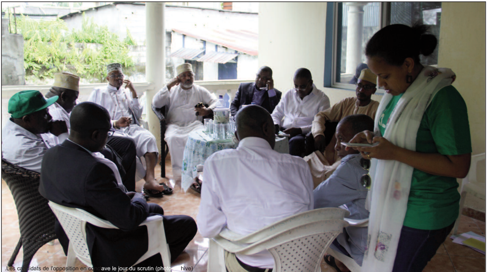
.Les candidats de l'opposition en conférence le jour du scrutin