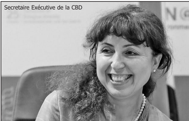
Secrétaire Exécutive de la CBD